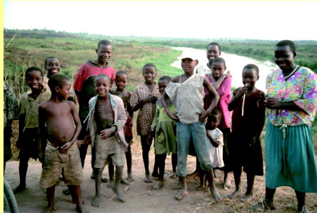
Kinder und Jugendliche am Kagera-Fluss in Missenye. Viele von ihnen können ohne Unterstützung niemals eine Schule besuchen.