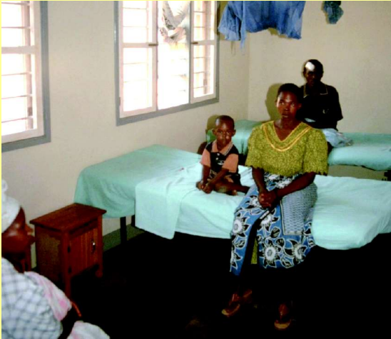
Krankenzimmer in Bugango

Der Kirchenkreis Lüdenscheid-Plettenberg unterstützt zwei Projekte: den Schülerstipendienfonds Missenye ( M.O.S.S. ) * sowie den Patientenhilfsfonds Poor Patients' Fund ( PPF ) *. Außerdem werden sporadisch Einzelprojekte gefördert. Dazu gehören Hilfen für Schulen oder die Anschaffung eines Krankentransportfahrzeugs.