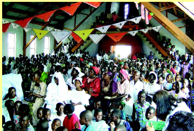
Gottesdienst in Minziro

Die Gemeinden sind in mehrere Bezirke unterteilt. Zusammen mit den ehrenamtlichen Mitarbeitern arbeiten in Missenye über 20 Evangelisten, drei Pastoren und der Superintendent. Jeder Gemeindebezirk hat etwa 200 bis 1000 Gemeindeglieder, die verstreut in Siedlungen und inmitten kleiner Bananenpflanzungen („Shambas“) wohnen.