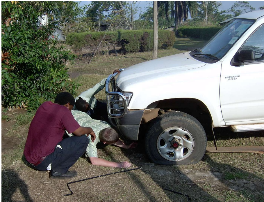
Der zweite Plattfuß an diesem Tag!

Motorrad für die Arbeit zur Verfügung. Trotzdem scheint alles nur „ein Tropfen auf den heißen Stein“ zu sein, mit mehr Mitteln könnte noch viel mehr getan werden.